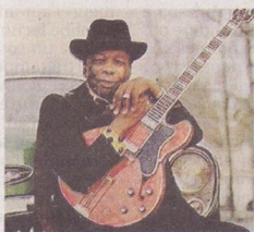
John Lee Hooker (1917-2001)

(buh) Come ogni edizione, anche quest'anno Blues Made in Italy ha voluto omaggiare uno dei pilastri del blues, inserendolo nel manifesto e nelle t-shirt da collezione. Ed eccolo lì, John Lee Hooker (1917-2001), con la sua Gibson Sheraton fra le braccia, che fa capolino proprio nel centesimo anniversario dalla sua nascita. Hooker è stato un cantante, chitarrista e compositore statunitense blues. Nato a Coahoma County, nel Mississippi, da una famiglia di musicisti (era il più giovane di undici figli), si appassionò alla chitarra dopo la separazione dei genitori, nel 1921, quando la madre sposa il